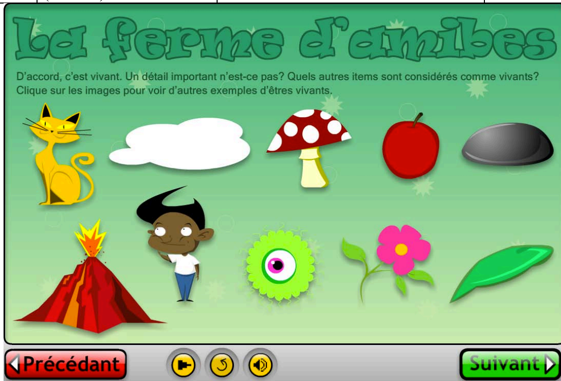
Figure 2 - ELO1358760